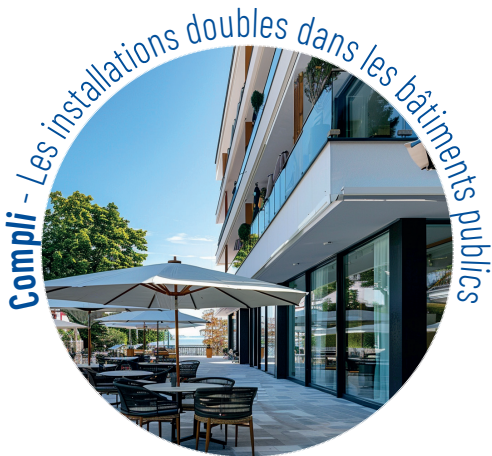
Compli - Les installations doubles dans les bâtiments publics